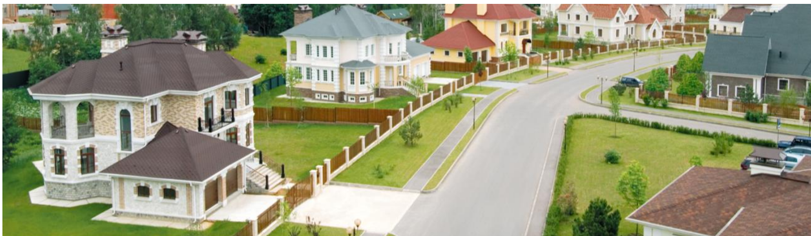
Жилой комплекс «Павлово»